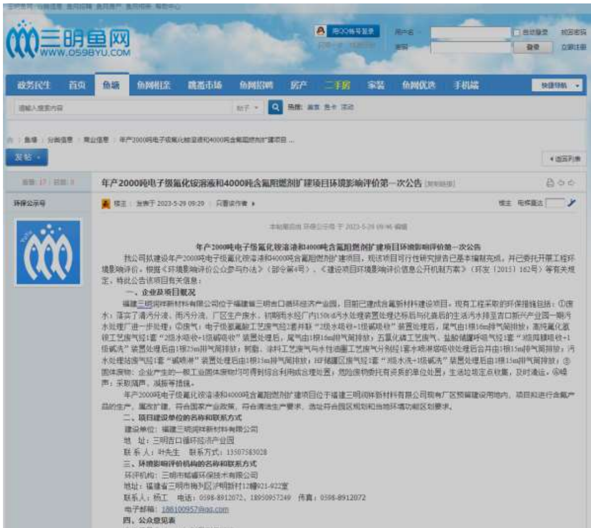
图 2-2 首次公示截图

首次公开信息在三明市小鱼网论坛上进行公示，公示起始时间为 2023 年 5 月 29 日至 2024 年 1 月 22 日，首次环境影响评价信息公示公告(登入网址： http://bbs.0598yu.com/forum.php?mod=viewthread&tid=619218&extra=page%3D1 )，截图见图 2-2。