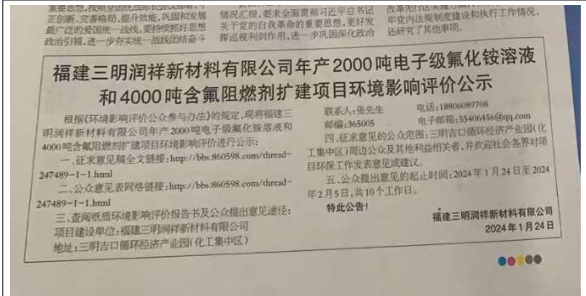
三明日报 2024 年 1 月 29 日公告

本报讯 1月26日，文化和旅游部副部长、国家文物局局长李群一行深入我市调研文物保护利用工作。省政协副主席江尔雄陪同调研。国家文物局相关的主要负责同志，省文化和旅游厅副厅长、省文物局局长傅强生，市领导杨兴忠、林善忠陪同调研。 在万寿岩，李群一行来到万寿岩国家考古遗址公园遗址博物馆和船政万寿岩遗址，认真学习时任福建省省长李鹏同志在万寿岩