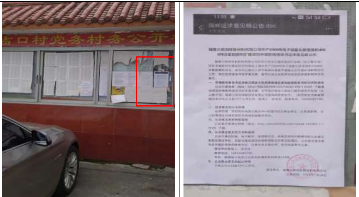
吉口村公告栏公示