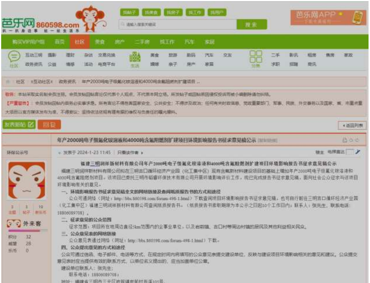
图 3-1 征求意见稿网络公示图

征求意见稿公示信息在三明芭乐网站上进行公示，公示起始时间为 2024 年 1 月 23 日至 2024 年 2 月 5 日，信息公示内容详见网站（网址： http://bbs.860598.com/thread-247489-1-1.html ），截图见图 3-1。