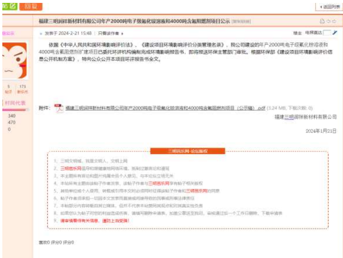
图 6-1 环评报告书全文（报批稿）公示截图

项目环境影响评价报告书（报批稿）公示信息在三明芭乐网网站上进行公示，公示起始时间为2024年1月21日，公开拟报批的环境影响报告书全文和公众参与说明。信息公示内容详见网站(网址: http://bbs.860598.com/thread-247718-1-1.html ，截图见图6-1。