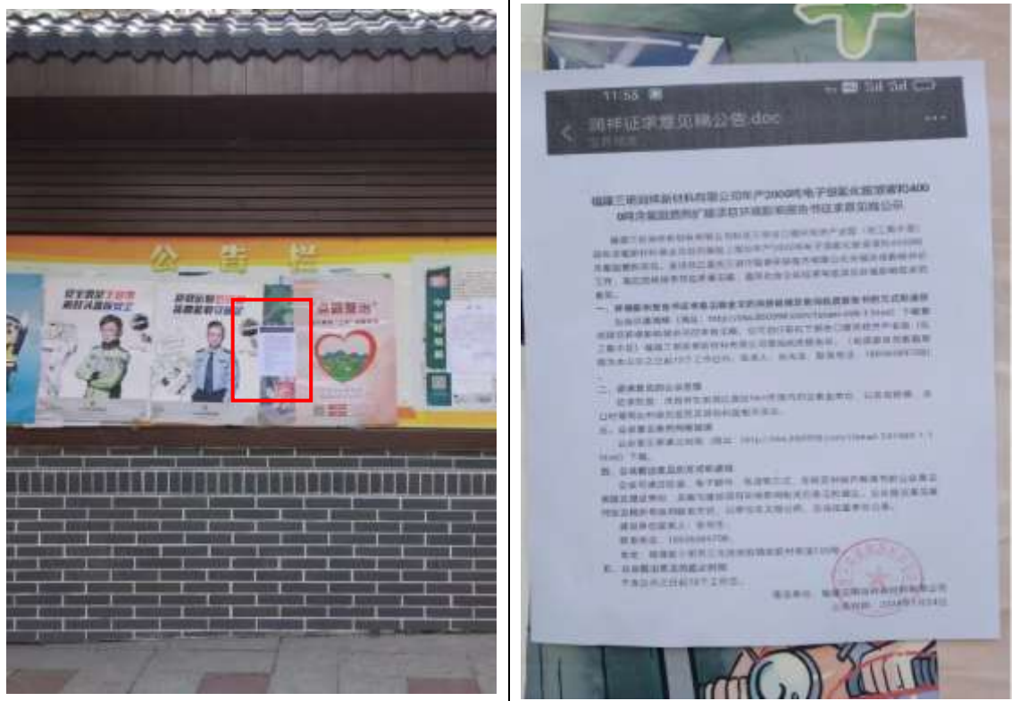
岩前镇公告栏公示

项目环境影响评价报告书征求意见稿公示公告张贴地点分别为吉口村、岩前镇、经济开发区公告栏。根据建设项目环境影响评价技术导则的要求，吉口村、岩前镇为项目环境影响评价范围内相近的环境保护目标，所以，报告书征求意见稿的公示公告张贴地点合理。公告时间为2024年1月23日至2024年2月5日，公告图片详见图3-3。