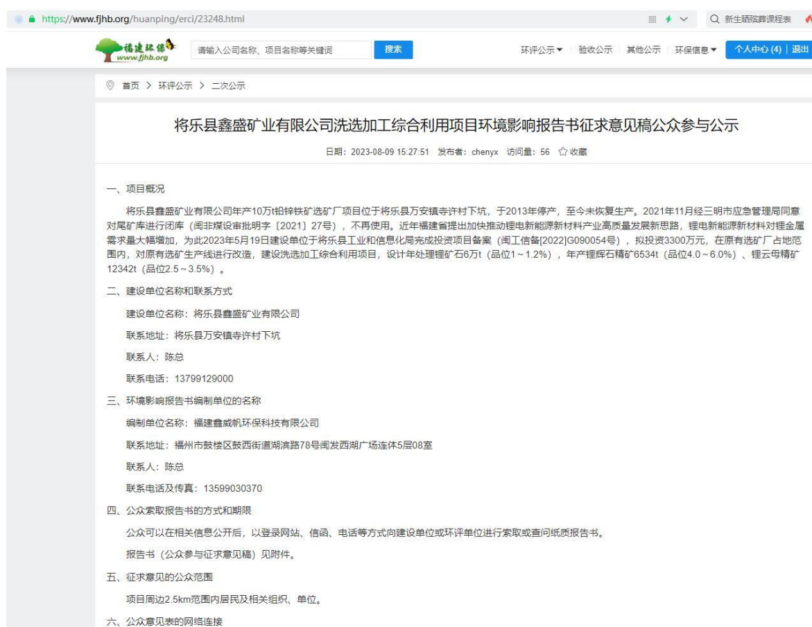
图2 征求意见稿公众参与网络公示截图

公示网址为： https://www.fjhb.org/huanping/erci/23248.html 。