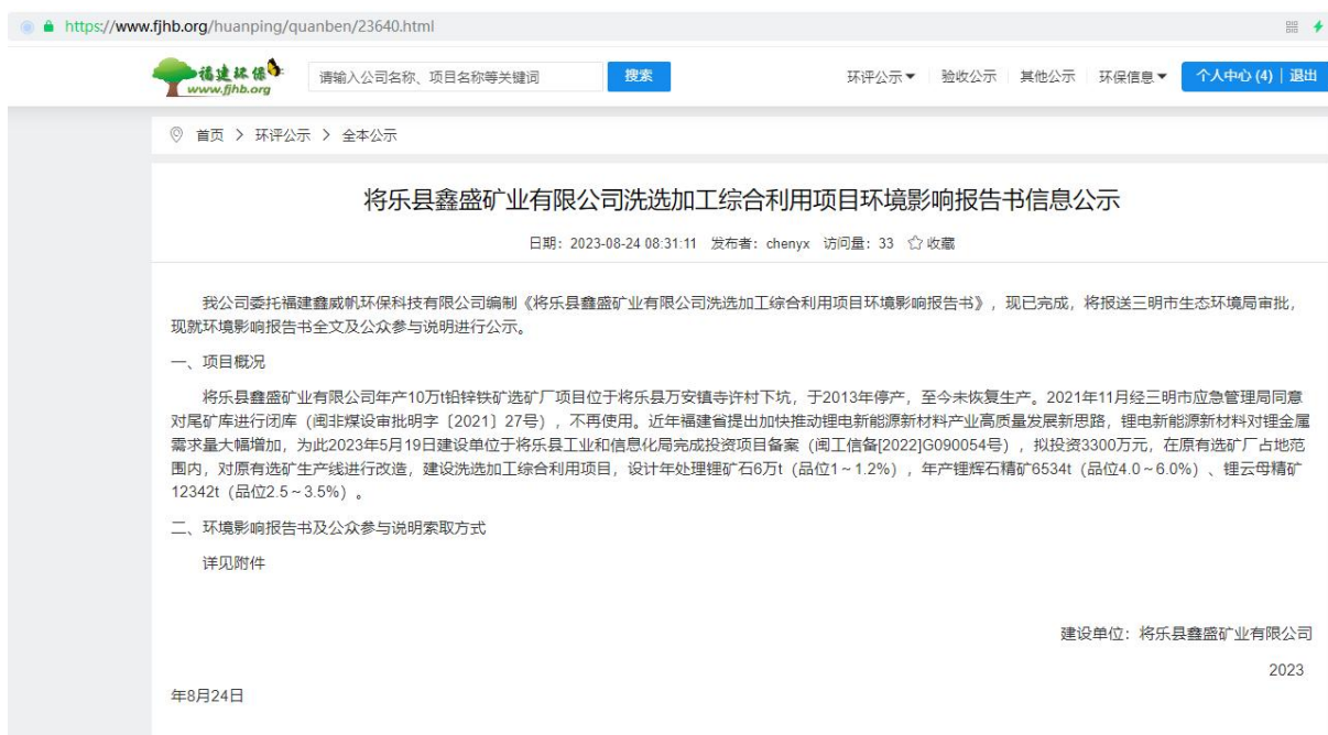
图 6 环境影响评价报送信息网络公开情况截图