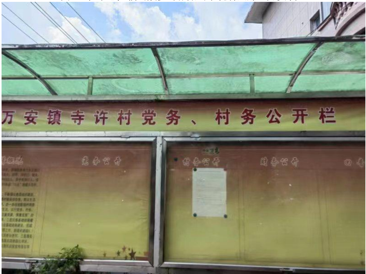
图5 征求意见稿公众参与张贴公示现场照片（寺许村）