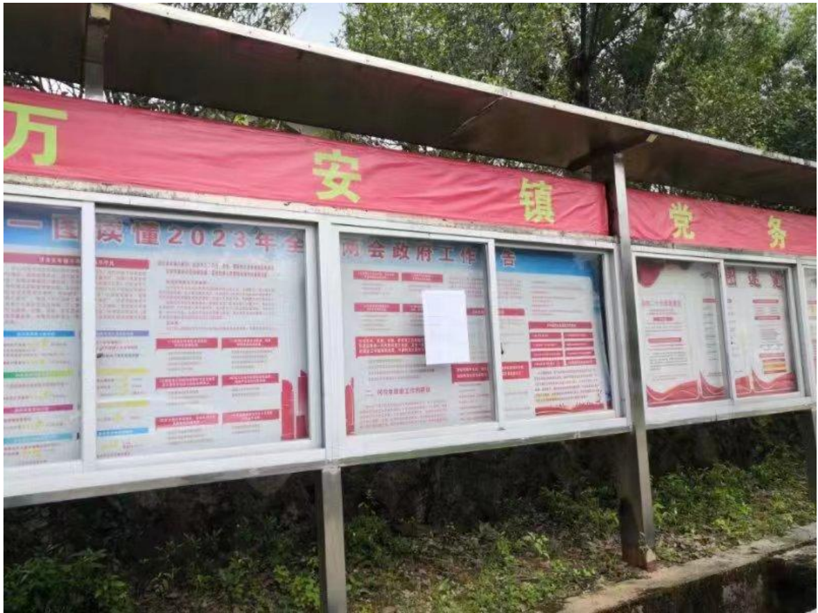
图4 征求意见稿公众参与张贴公示现场照片（万安镇）